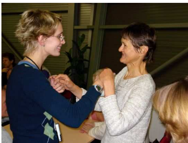
Komunikace v taktilním znakovém jazyce