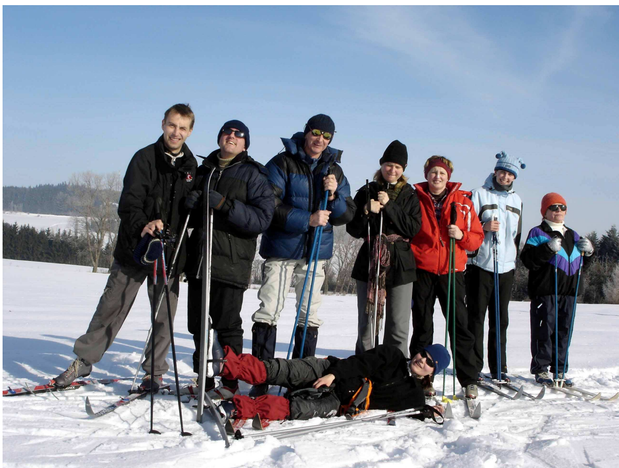
Skupinka hluchoslepých běžkařů se svými traséry na 2. zimním pobytu na Vysočině

Občanské sdružení LORM – Společnost pro hluchoslepé