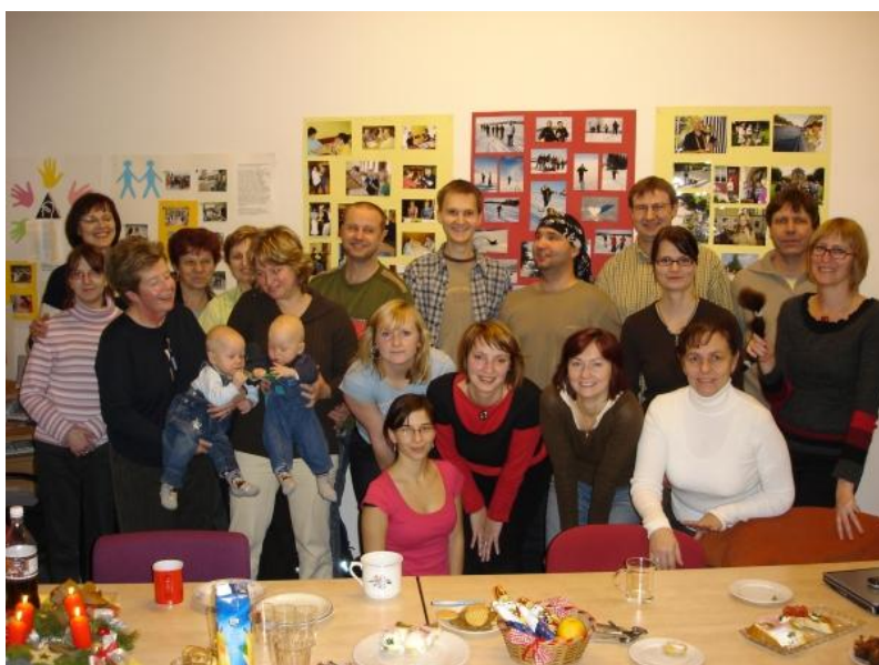
Tým zaměstnanců a dobrovolníků o.s. LORM, prosinec 2007

Pracovní tým se v roce 2007 sestával z metodičky, skupiny terénních sociálních, oblastních pracovníků a ergoterapeutky, působících v osmi krajích, pěti poradenských center v Praze, Brně, Liberci, Olomouci a Ostravě, a terénně v rámci celé republiky; dále členy týmu tvořila ředitelka, odborná asistentka a hospodářsko - administrativní pracovník. Organizace spolupracovala s řadou externistů a dobrovolníků.