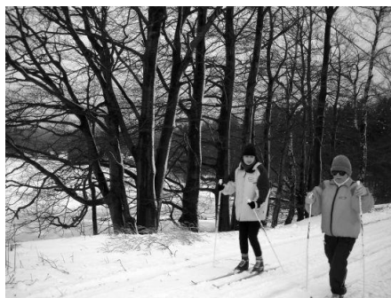
Zimní pobyt na běžkách ve Škrdlovicích

Edukačně rehabilitační pobyty patří již tradičně do nabídky našich stálých sociálně aktivizačních služeb. Týdenní skupinové pobyty jsou zaměřené na sociální rehabilitaci a rozvoj komunikace u hluchoslepých a konají se v zajímavých lokalitách a rekreačních střediscích Čech a Moravy. Kromě sociální rehabilitace a rozvoje komunikace doplňujeme programy pobytů o nové prvky, např. běžecké lyžování, turistiku, arteterapii, muzikoterapii, hipoterapii apod. Veškeré sociální služby zajišťované na pobytech mají hluchoslepí klienti zdarma, přispívají si pouze na ubytování a stravování ve výši 50 % nákladů. V roce 2007 se jednalo o příspěvek 1600 Kč za týdenní ubytování s plnou penzí na letní kurzy a 1800 Kč za zimní pobyt.