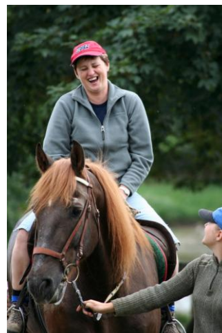
Hipoterapie ve Šrkdlovicích, srpen 2007