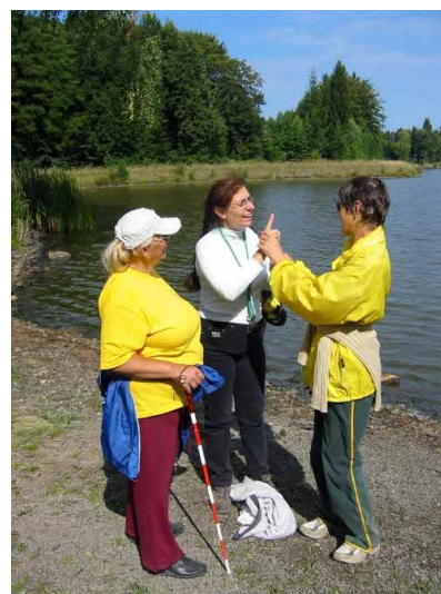
Komunikace v taktilním znakovém jazyce

Registrace zahrnuje sociální služby zajišťované ve všech krajích České republiky a regionálních poradenských centrech o.s. LORM.