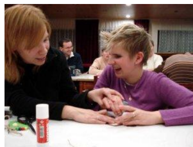
Arteterapie na pobytu ve Škrdlovicích