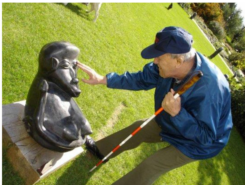
Výstava Sochy ze Zimbabwe, Botanická zahrada, Praha

Občanské sdružení LORM – Společnost pro hluchoslepé