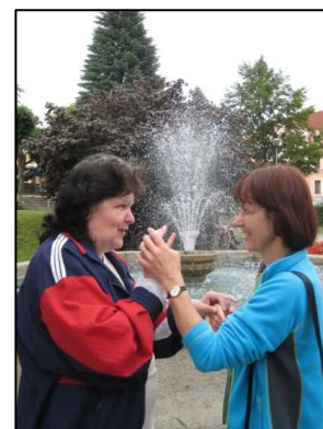
Komunikace v taktilním znakovém jazyce

Registrace zahrnuje sociální služby zajišťované ve všech krajích České republiky a regionálních poradenských centrech o.s. LORM.