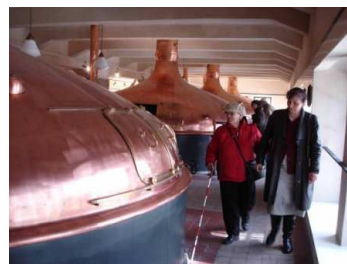
Návštěva pivovaru, Plzeň