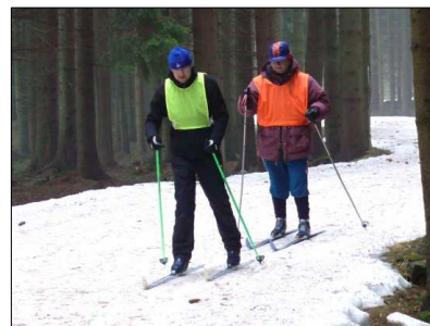
Zimní pobyt na běžkách na Vysočině