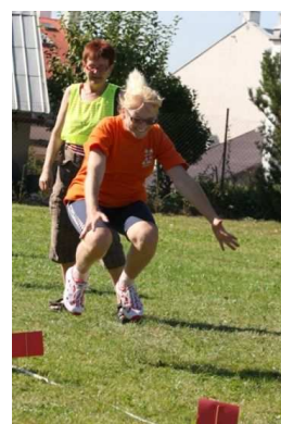
Lormolympiáda ve Sněžném, září 2008